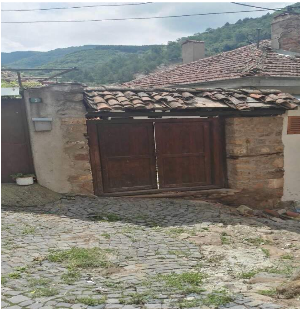
Fotografia numër 2- Porta kryesore e Shtëpisë së Sokolëve