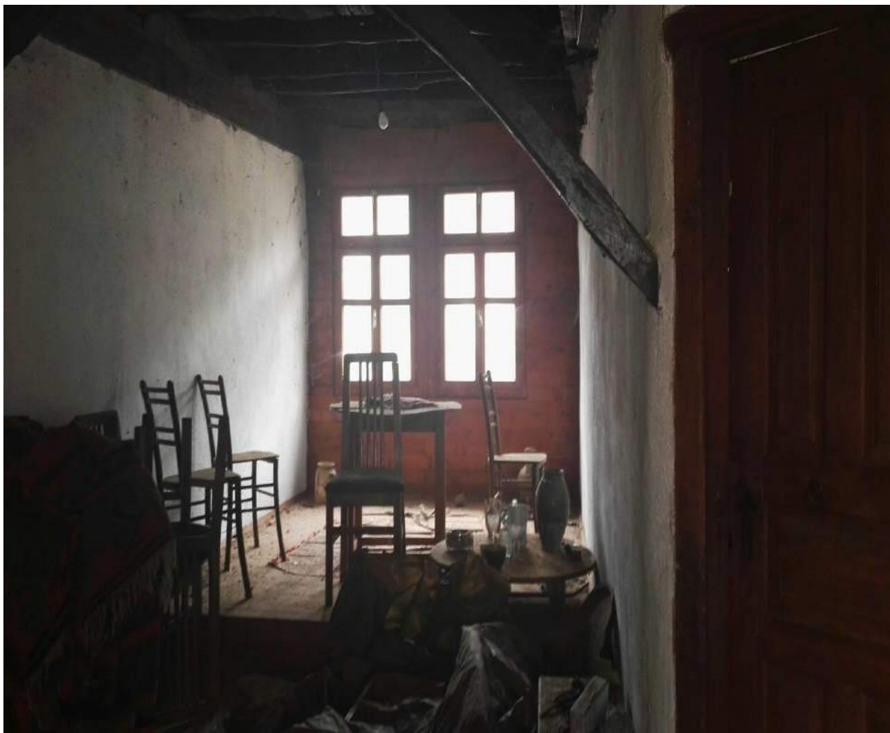
Fotografia numër 3- Ballkoni i brendshëm në Shtëpinë e Sokolëve