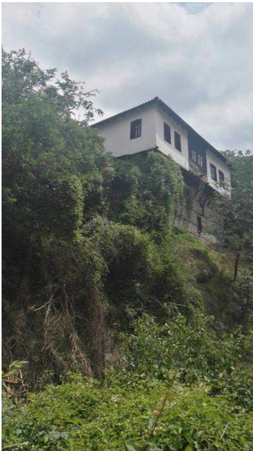
Fotografia numër 1 -Pamje nga Shtëpia e Sokolëve nga lumit Mancina