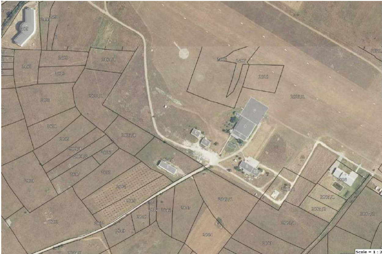
Fotografia 1 Vendndodhja e restaurantit të ardhshëm modern të objektit të kantinës