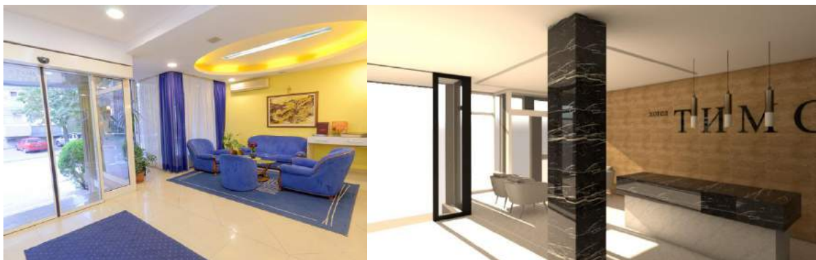
Лоби и рецепција –Гарнитура и столарија