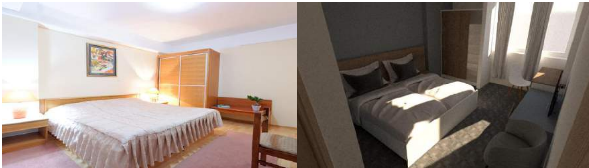
Dhomat dhe apartamentet