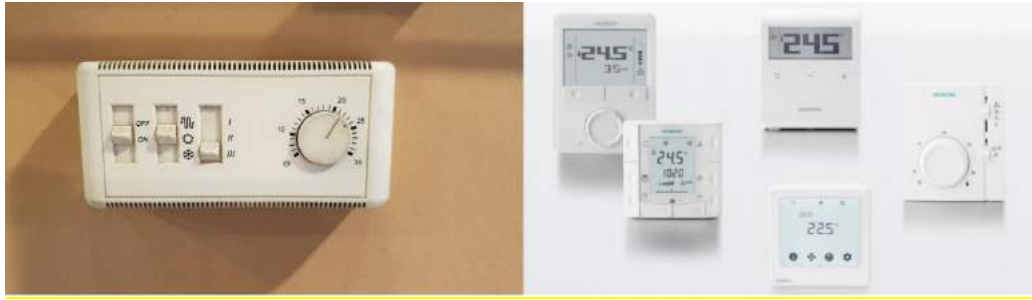
Para dhe pas