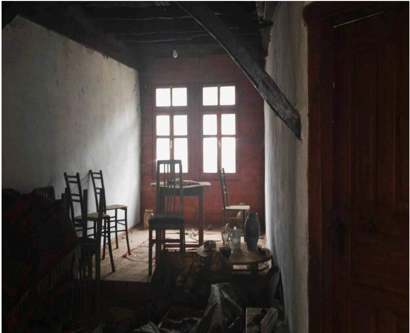
Слика 3 - Внатрешен чардак во Куќата на Соколови