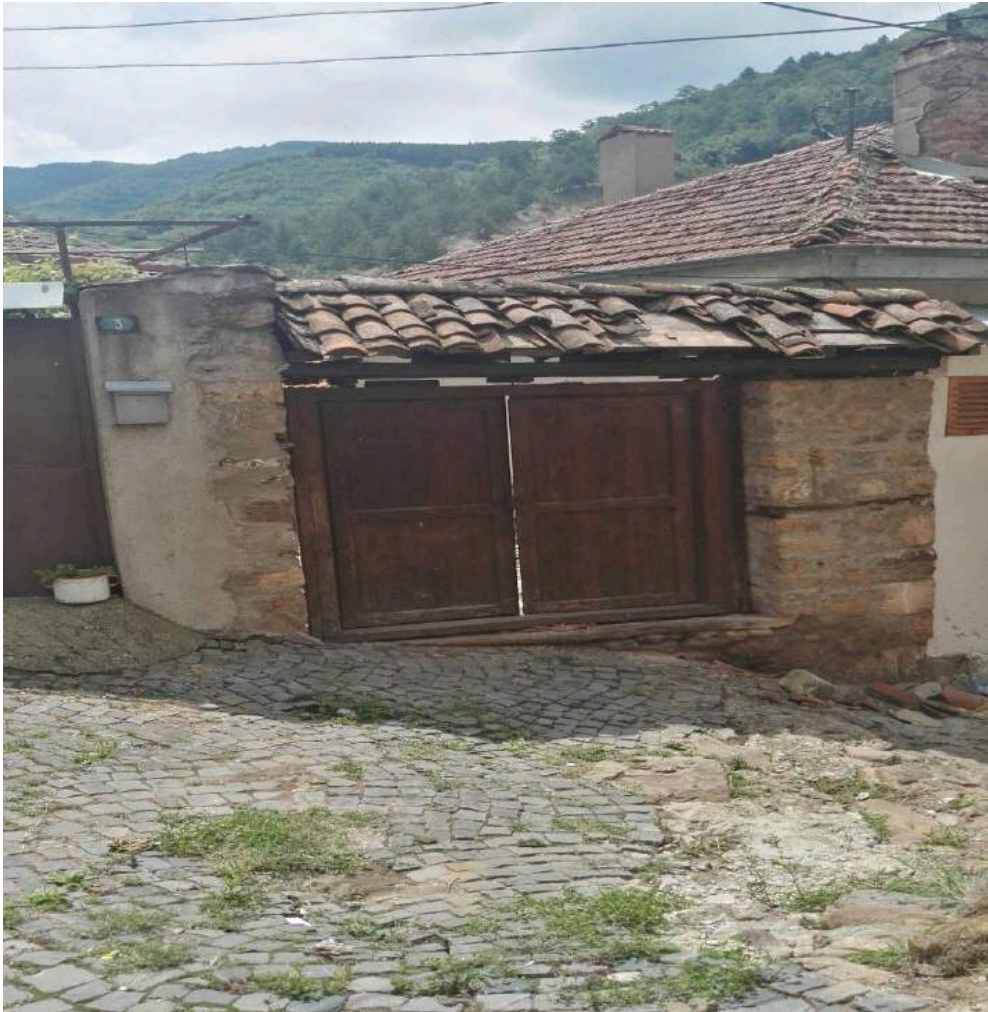
Слика 2 Главната порта на Куќата на Соколови