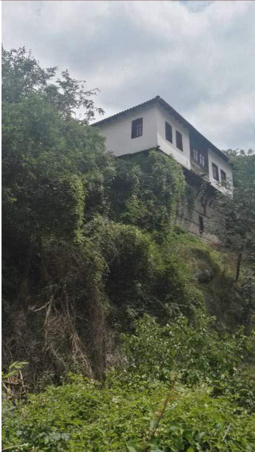
Слика 1 Поглед од Куката на Соколови кон Манцина Река