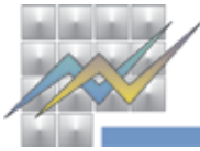
T-02: Број на туристи и ноќевања по видови туристички места и по видови објекти за сместување, јуни 2018 T-02: Number of tourists and nights spent by types of tourist resorts and by types of accommodation establishments, June 2018