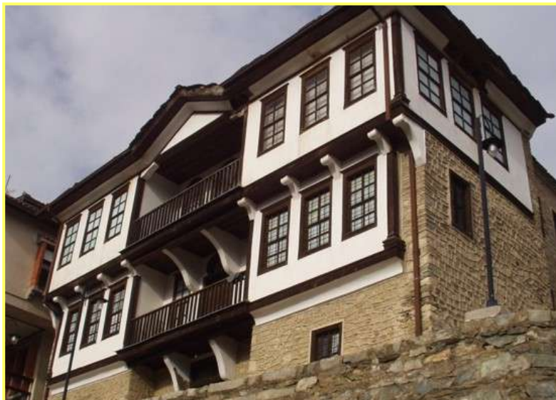
Галерија Никола Мартиноски

Покрај културно-историските споменици, градот изобилува и со стари куќи изградени со посебен архитектонски стил и затоа Крушево се нарекува и музеј на стара архитектура.