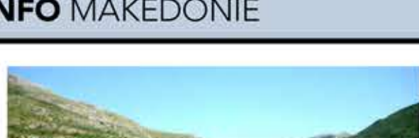
KLÁŠTER SV. JANA KRATOVO Z ROKU 1020 POBLŽÍ GARI.