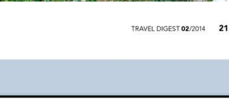
KLÁŠTER SV. JANA KRATOVO (ST. JOVAN BIGORSKI) JE ZNÁMÝ DŘEVĚNOU IKONOSTASÍ (OLTÁŘEM Z IKON).