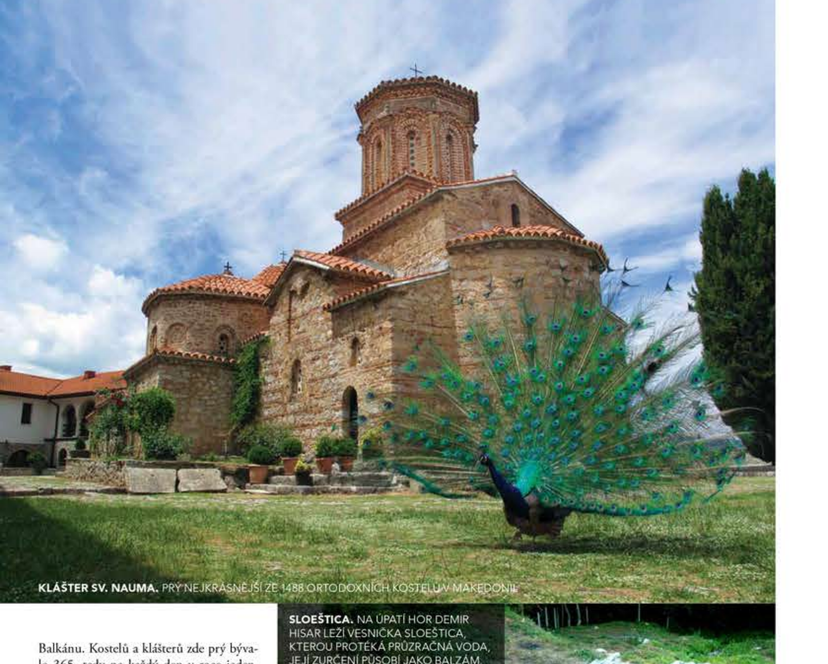
KLÁŠTER SV. NAUMA. PŘYNEJ KRÁSNĚJŠÍ ZE 1488 ORTODOXNÍCH KOSTELŮ V MAKEDONII

Balkán. Kostelů a klášterů zde přý bývalo 365, tedy na každý den v roce jeden. Dnes už zdaleka všechny neexistují, nicméně jejich množství je i dnes úctyhodné a udivující.