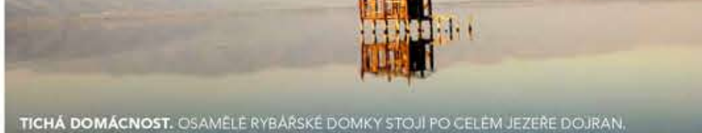
TICHÁ DOMÁCNOST. OSAMELÉ RYBÁŘSKÉ DOMKY STOJÍ PO CELEM JEZERĚ DOJRAN.

→ něných hvězd. Jako galerie pod širým nebem však působí celé Skopje. Na spouze narazíte na každé kolo. Veřejná glorifikace hrdinů makedonského dějin je součástí strategické obnovy města. Východoslovenské vlivy však v sobě tvrdí neapropi. Na širokých bulvárech s převážně socialistickou zástavbou, na každém náměstíčku a jiném vhodném volném místě stojí bronzová nebo mramorová socha nejméně v životní velikosti. Vrcholem je vítězství oblouk s 15 jezdeckými sochami a pomníkem padlým hrdinům, sekunduje mu 22 metrů vysoká bronzová socha Alexandra Velikého na koni na vrcholu mramorové fontány na ústředním náměstí hráčící vážnou hudbu. Pár obřích věrozvůstů u paty kamenného mostu a fontána s matkami, jejichž klín by unesl vedle bronzového dítěte i celou školní třídu, jen dotvářejí bizarní obraz. Nejdřív nevěříme svým očím, po pár dnech nřímáme oblíbení sochy jako kolorit. Místní výstavu nadělní, přestavba centra města sice bude stát