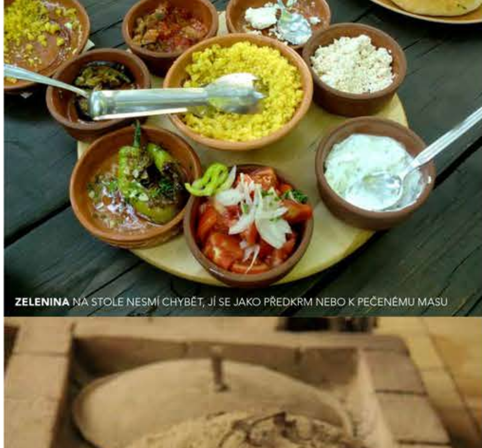
ZELENINA NA STOLE NESMÍ CHYBĚT, JE ŠRUBO JAKO PŘEDKRM NEBO K PEČENÉMU MASU

Ve starém bazaru navštívte Daut Pasha Hammam (Kruševska 1a). V bývalých tureckých lázních z 15. století vznikla už v roce 1948 galerie současného umění. Charakter stavby je zachován, koupací sály a tepidária se na výstavy uměleckých artefaktů skvěle hodí, nezapomene se podívat nahoru – do kopule plně skle-